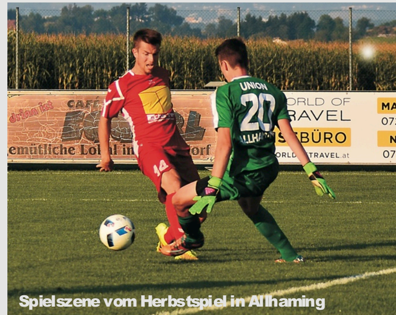
Spielszene vom Herbstspiel in Allhaming